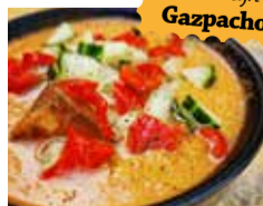
Heerlijk in de zomer: Gazpacho of Tabouleh