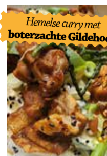
Hemelse curry met boterzachte Gildehoen