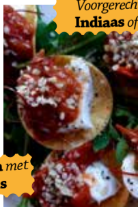
Voorgerechten op z'n Indiaas of Italiaans