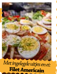
Met ingelegde uitjes en ei: Filet Americain