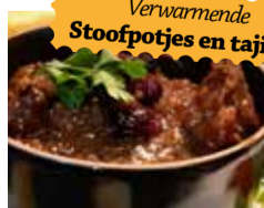
Verwarmende Stoopotjes en tajines