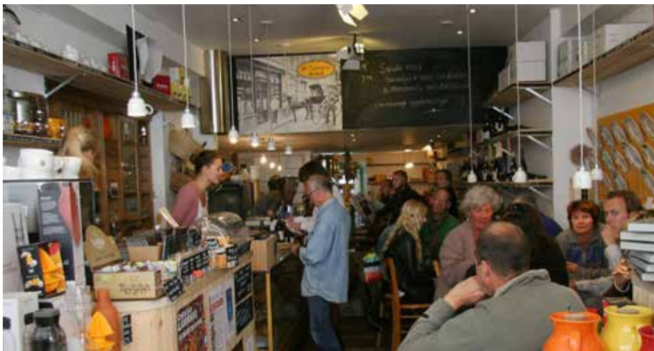
De eerste drukke zaterdagen

Al snel zat ons kleine pijpenlaatje iedere lunch vol. Op zaterdag zaten de mensen zelfs spontaan op de randjes tussen de producten. Zelf renden we nog ongeorganiseerd in de rondte. Van de jonge meiden die we in het begin aannamen, leerden we onze eerste horecavaardigheden. 'Neem op de terugweg met een leeg blad gelijk spullen voor de afwas mee...' Zo leerden we tijdens de eerste drie jaren en werden we telkens handiger.