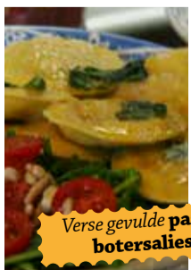
Verse gevulde pasta met botersaus