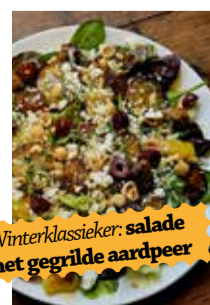
Winterklassiker: salade met gegrilde aardpeer