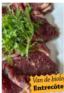
Van de biologische slager: Entrecôte en Salsiccia