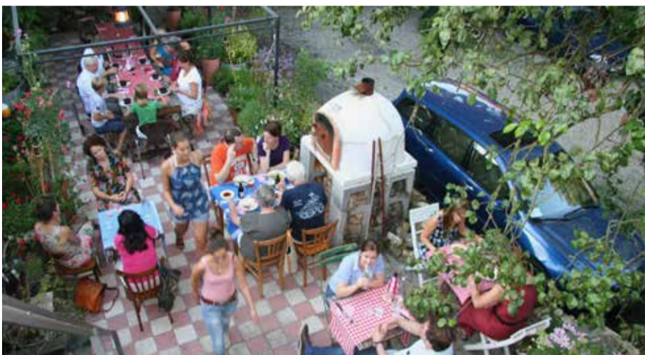
Ons smalle terras naast de - toen nog - aangrenzende parkeerplaats

Het werd ons duidelijk dat we eigenlijk van een winkel- naar een horecaverunning moesten proberen te gaan. Zo zaten de gasten, zodra het lekker weer was, graag aan de lange tafel op het terras achter Melkmarkt 8. We mochten ze officieel echter alleen gratis verschillende soorten water schenken. Of binnen iets laten bestellen en dat dan als takeaway mee naar buiten geven. Kortom, we liepen tegen de grenzen aan van wat onder de geldende vergunning mocht.