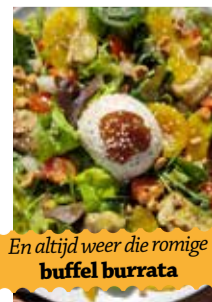
En altijd weer die romige buffel burrata