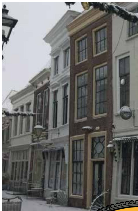
Sneeuw op de Melkmarkt

Een stadje dat ik als zeiler al fantastisch vond. We struinden samen Zierikzee af en vielen als een blok voor de te koop staande kinderkledingwinkel op Melkmarkt 8, die net binnen ons budget bleek te vallen. Ik weet het nog zo goed; op de dag dat we het huis voor het eerst gingen bezichtigen, sneeuwde het. Zo werd 'ons' statige witte pand nog witter en mooier.