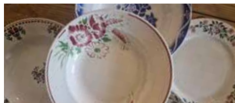
De Franse bordjes van Monique

Die zaken werden het net niet maar we bleven dromen. Tijdens onze vakanties in Frankrijk verzamelden we alvast stoeltjes en bordjes voor als het avontuur er ooit wél van zou komen. Wat dat nu precies was? Eigenlijk wisten we dat zelf nog niet precies. Monique wilde in ieder geval haar passie voor koken en bijzondere smaken delen en fantaseerde over een winkeltje met delicatessen. Ik dacht meer in de richting van een klein restaurantje, waar ook muziek gemaakt kon worden. Wat we allebei in ieder geval wilden, was een plek creëren waar de sfeer zo zou zijn als bij ons thuis. Een pure, niet gekunstelde plek, waar mensen zich direct op hun gemak zouden voelen.